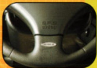
Airbag conducteur dans le volant