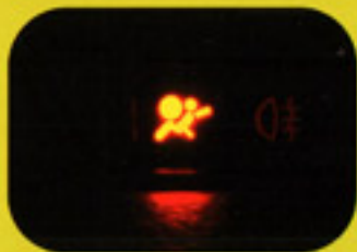
Voyant qui signale la mise en marche du boîtier électronique lors du démarrage (Reste allumé quelques secondes)