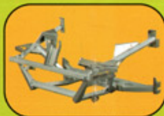
Support moteur absorbeur de choc