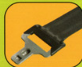
Ceinture de sécurité avec limiteur d'effort