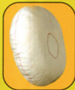
Airbag de 60 litres